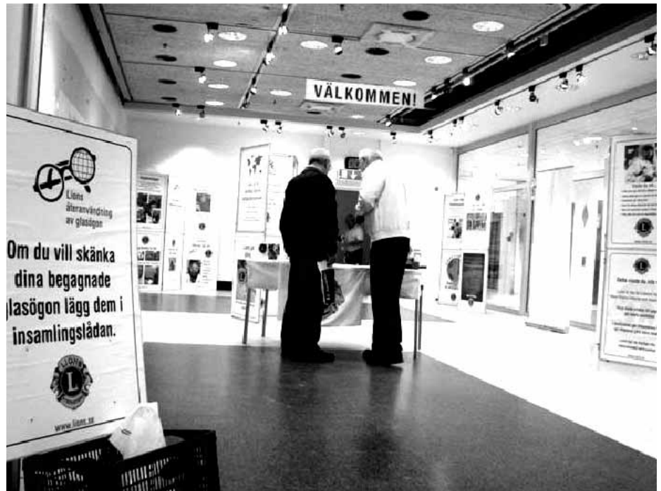
Lions Gösta informerar en besökare om vår verksamhet.

Mycket uppskattat var också vår insamling av glasögon. Omkring 1000 par gav vår annons om att man den 27 och 28