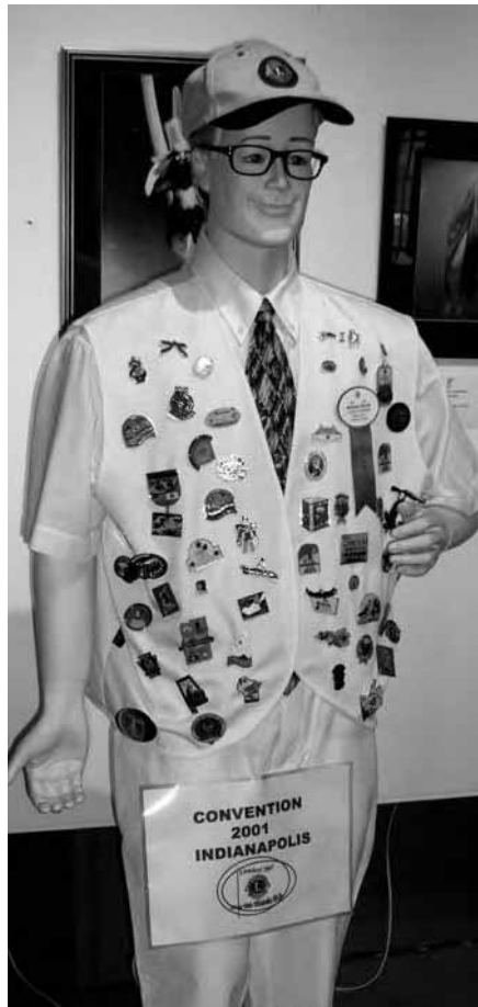
Som en kul grej på receptionen styrde vi ut dockan "Boxer-Robban" med diverse Lionspins från ett besök på Lionsconvention i USA.

Ett mål med vårt firande var att synas och ett krav för stödet till föreningarna var att vår logo